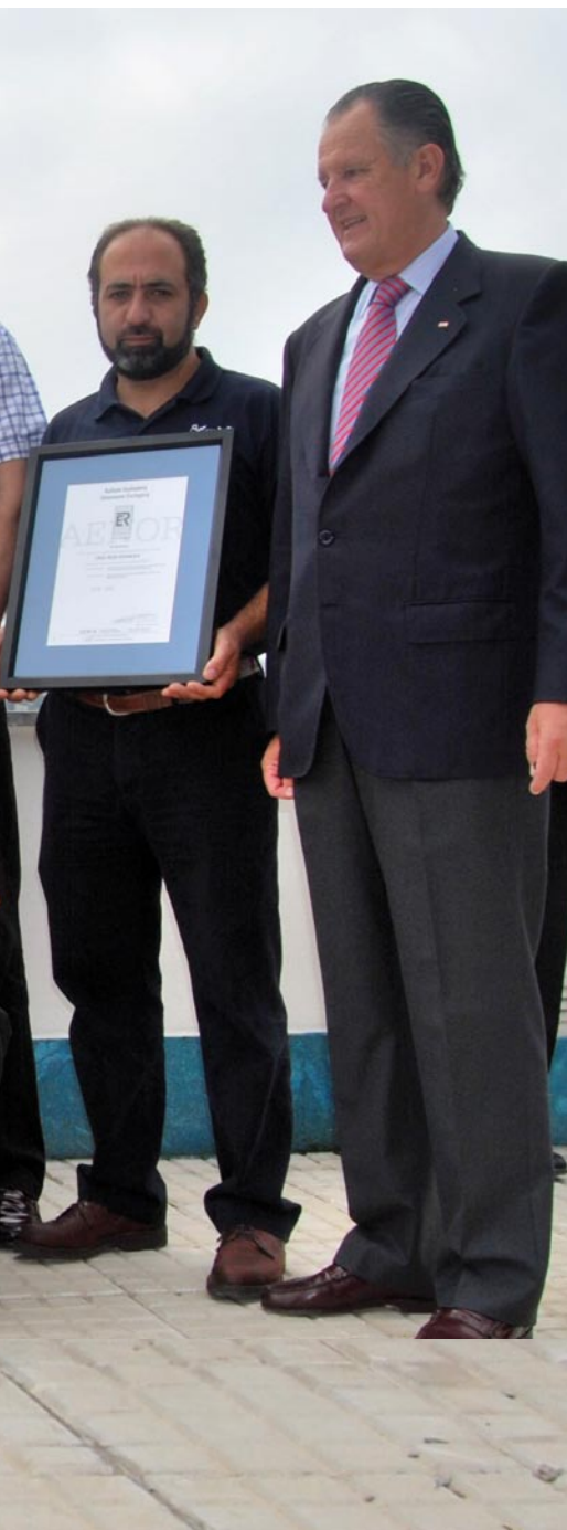
>> Voluntarios y trabajadores del área de Prevención, Salvamento y Socorrismo reciben el Certificado de Calidad ISO 9001 como reconocimiento al trabajo bien hecho.