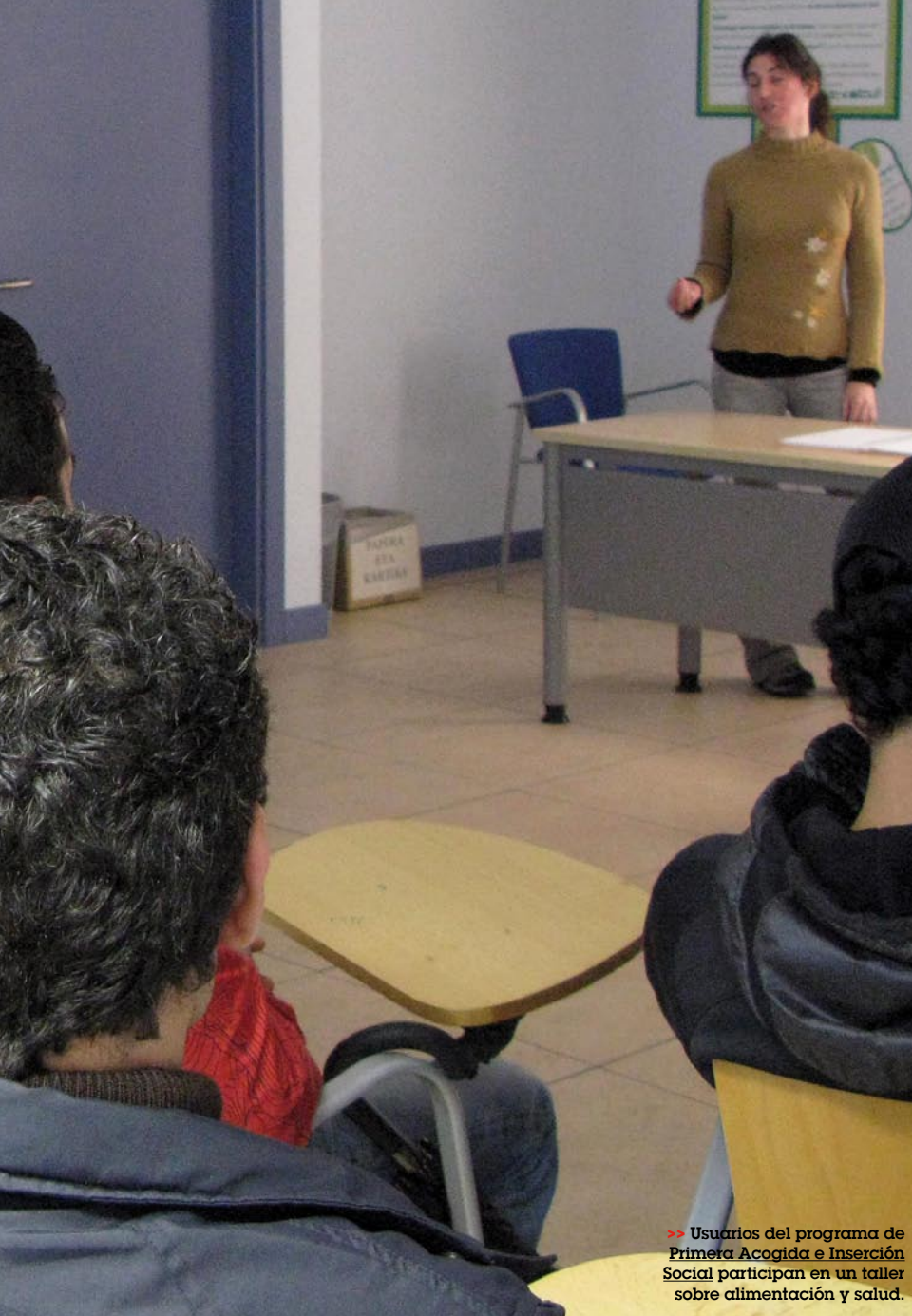
>> Usuarios del programa de Primera Acogida e Inserción Social participan en un taller sobre alimentación y salud.