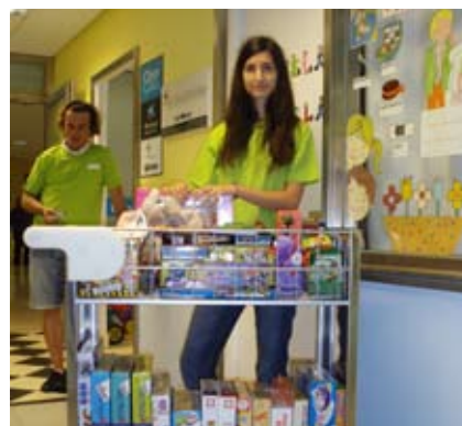
>> Voluntarios de Cruz Roja Juventud con la ludoteca que se adquirió gracias a los fondos recaudados en la campaña.

Otra acción desarrollada por Cruz Roja en Álava se encuentra en el hospital de Txagorritxu de la capital. Cerca de 40 voluntarios y voluntarias acuden los fines de semana al centro hospitalario para realizar diversas actividades con los menores de larga hospitalización. Cerca de 300 niños y niñas verán mejorada sus condiciones de vida mientras deban permanecer ingresados.