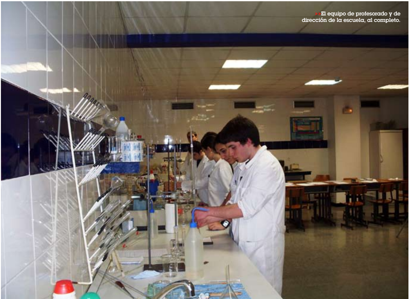
>> El equipo de profesorado y de dirección de la escuela, al completo.

En un informe referente a la Organización y actividades de Cruz Roja Española, que data del año 1962, encontramos: "La sección de Enfermeras dirige todo lo referente a enfermeras, tanto profesionales como voluntarias. Organiza las escuelas, enseñanzas, exámenes, destinos, becas, viajes, etc.". Bajo la dirección de la sección de enfermeras se realizaban cursos para damas auxiliares voluntarias en 40 hospitales, clínicas y dispensarios, adquiriendo en el plazo de dos años los conocimientos necesarios para prestar asistencia, ayudando al personal médico, previa demos-