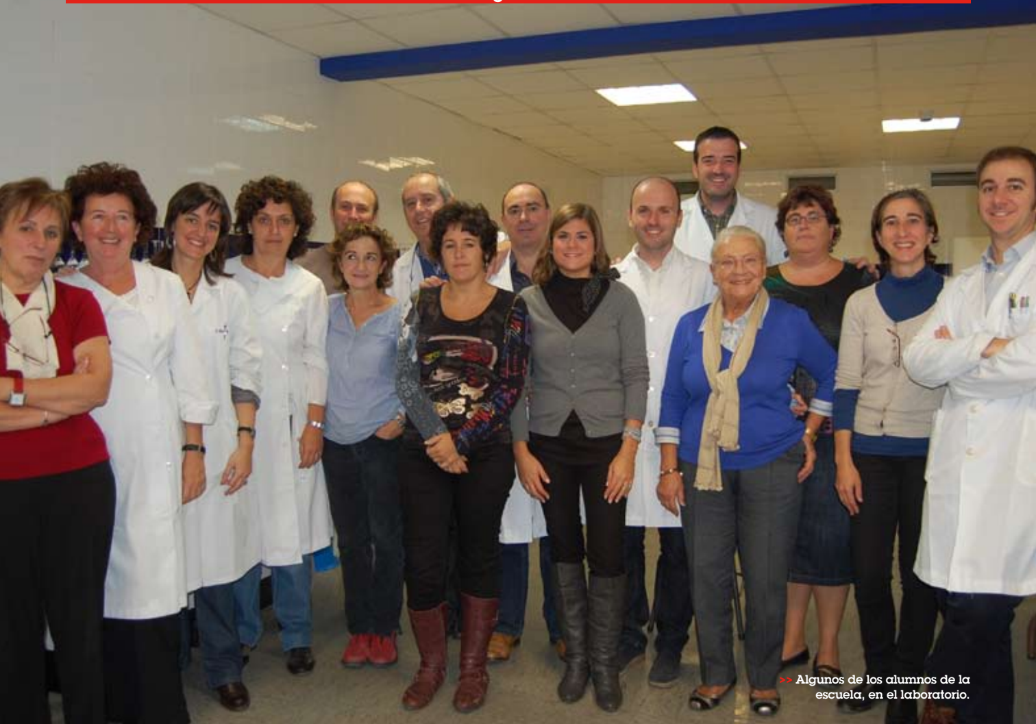
>> Algunos de los alumnos de la escuela, en el laboratorio.

tración de su aptitud mediante rigurosos examen ante tribunal".