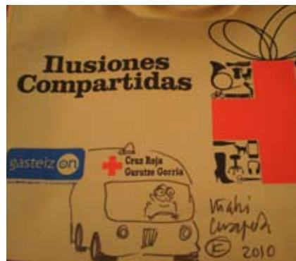
>> Viñeta dibujada por el caricaturista Iñaki Cerrajería sobre una bolsa de Ilusiones Compartidas .